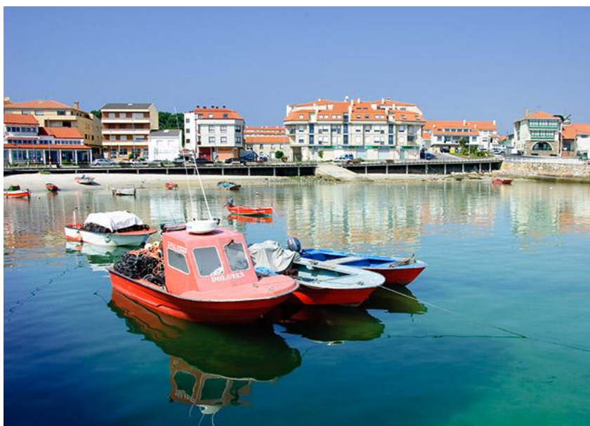
Fachada actual de Aguiño

A día de hoxe, a Confraría de Pescadores de Carreira e Aguiño está a iniciar un proceso de recoñecemento público da vida dos seus pescadores e das súas familias, os verdadeiros protagonistas do rexurdimento desta vila costeira.