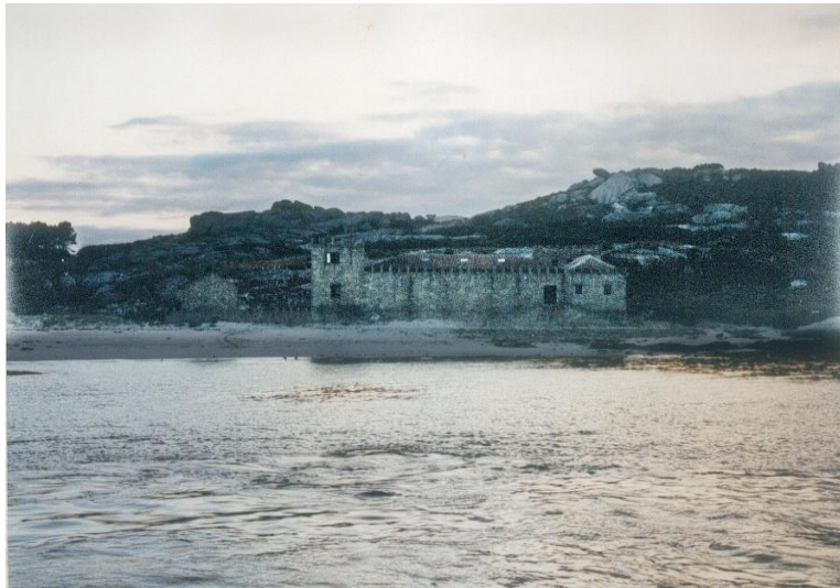
Almacén de Sálvora

Desde ese momento, o areal aguiñense comeza a poboarse fundamentalmente coas xentes de Carreira, que abandonan o traballo no agro para dedicarse á pesca, e cos habitantes da Illa de Sálvora.