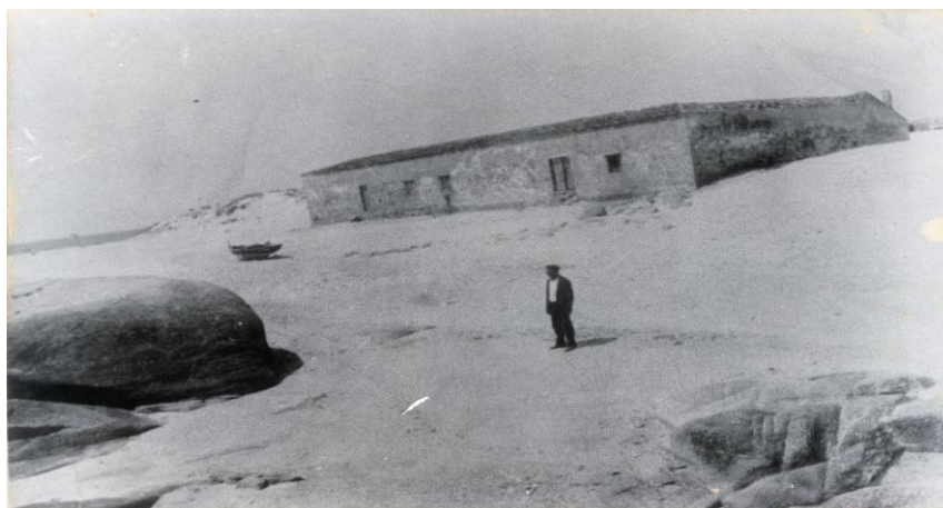
Almacén da Catía

A progresiva instalación doutras fábricas de salgadura, maioritariamente de orixe catalán, contribúen a continuar co crecemento próspero de Aguiño.